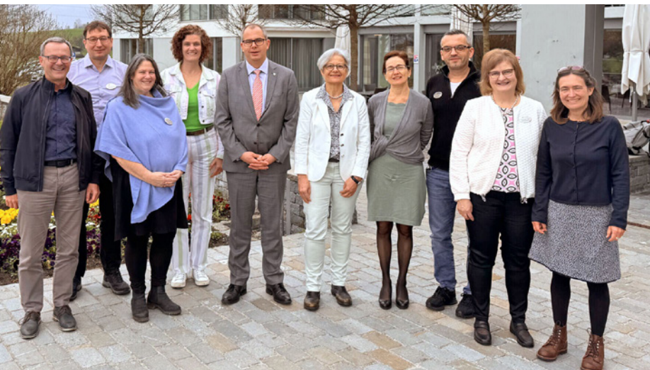
Besuch im Neuhaus Wängi