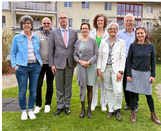
Besuch im Sunnwies, Tobel