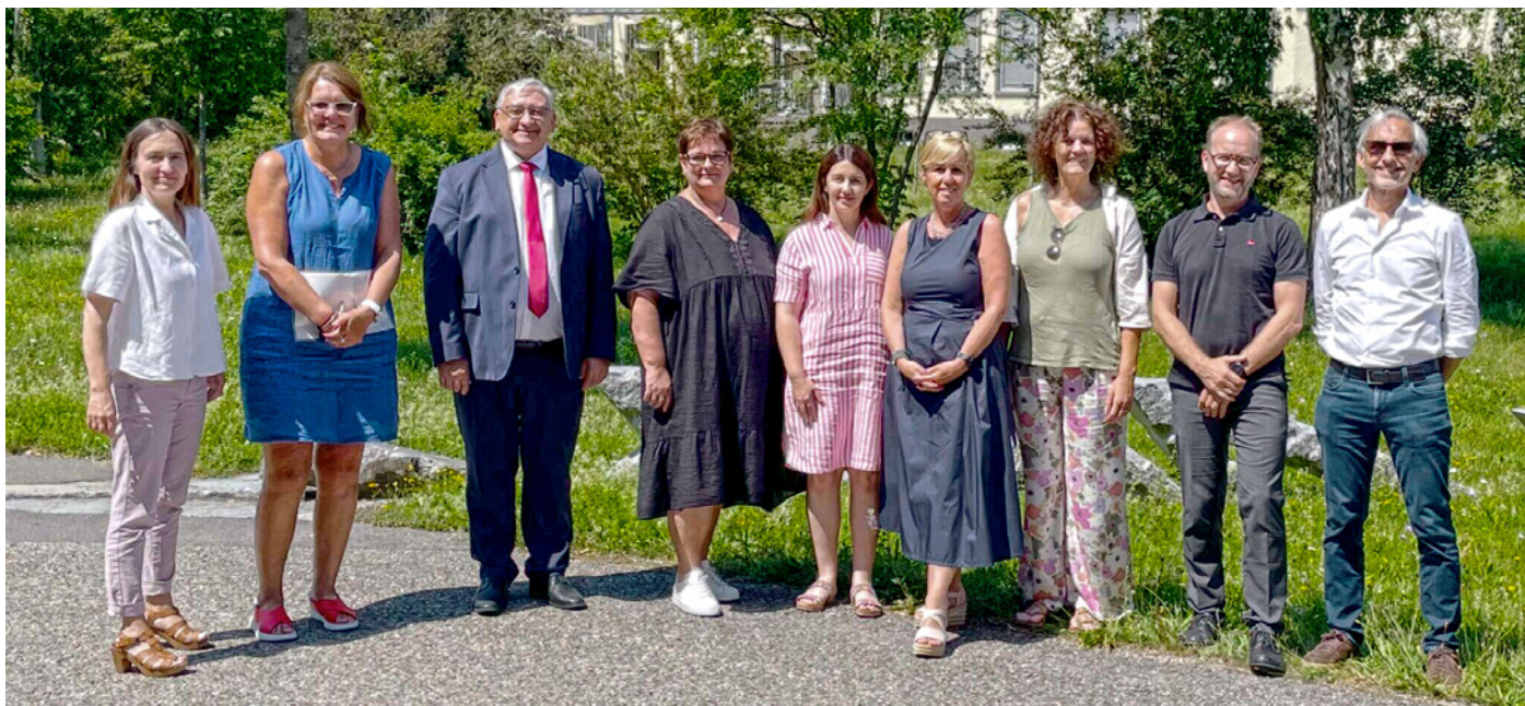
Kick-off CarevolutionAI am ZfP, Reichenau, Konstanz

Mit dieser Beteiligung leistet die CURAVIVA Thurgau einen aktiven Beitrag zur evidenzbasierten Weiterentwicklung digitaler Assistenzsysteme in der Langzeitpflege.