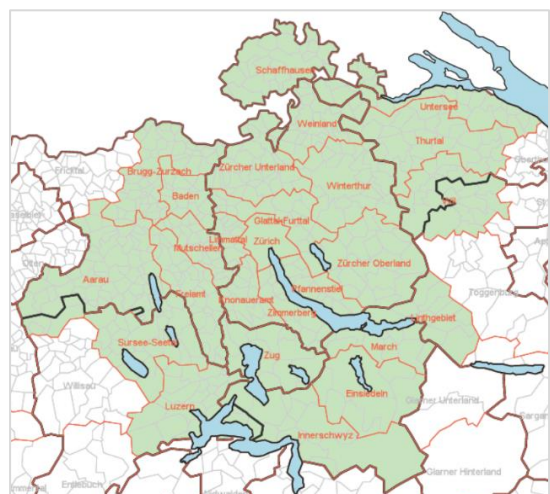
Der Metropolitanraum Zürich umfasst die Kantone Zürich, Zug, Schwyz, Schaffhausen und Teile der Kantone Aargau, Luzern, St. Gallen und Thurgau.

Sind Sie im Metropolitanraum Zürich als PolitikerIn, GemeinderätIn in Aufsichtsgremien von Altersheimen, Institutionen und Spitälern tätig, sind Sie als GeschäftsführerIn eines solchen Betriebes auch für die Gemeinschaftsgastronomie verantwortlich, oder